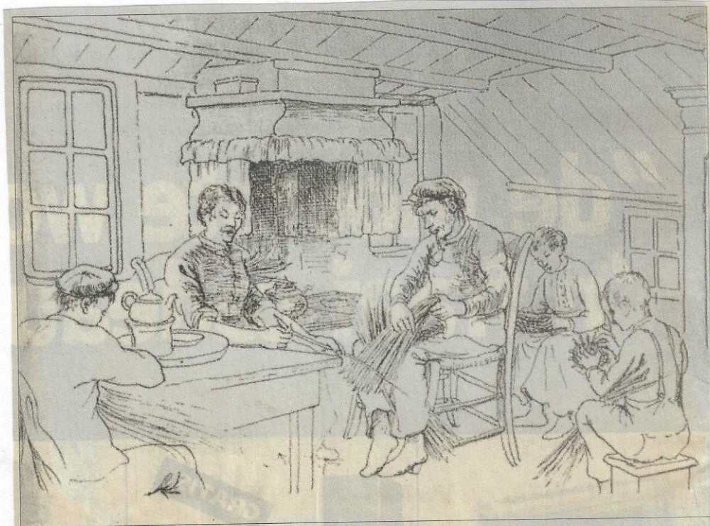
Thuiswerk van een gezin in een heidehut bij Houtigehage begin 20e eeuw.

HOUTIGE HAGE - Wie eenigszins in de gemeente Smallingerland bekend is, kent ook de heidestreek Houtigehage. Wie er niet bekend is, kan zich moeilijk voorstellen in welke ellendige krotten velen daar verblijf houden. En de ellendigste krotten, drie in getal zijn... gemeente-eigendom. Laat ons er een kijkje nemen. 'n Beetje voorzichtig, want ge stapt, de eenige deur binnenkomend, in de laagte neer. De lui wonen dus ten deele in den grond. Dat is warm in den winter. Anders is er voor de warmte al weinig gedaan, want de vrouw verzekert ons, dat de woning bij hunne komst slechts bestond uit vier kale zwarte spitsmuren en een strooien dakje. Daarin waren geplaatst twee houyen bakken, die men ledikanten noemde. In deze woning omstreeks 3½ meter lang en breed, 1½ meter hoog, moeten zes personen eten, drinken en slapen. Een jongen van zestien jaar deelt het bed met een 33-jarige zuster en haar kind! Het tweede gebouw bevat twee zulke woningen. In 't eene vertrek moeten acht personen verblijf houden. De deur kan niet voldoende gesloten worden. In de andere helft moeten zeven personen verblijf houden. Twee jongens moeten 's nachts op de aarden vloer slapen. Mag zoo 'n toestand zoo blijven?"