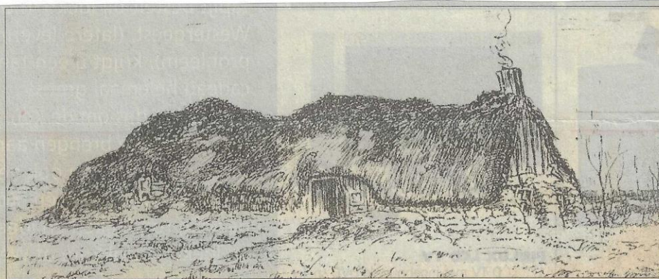
Heidehut bij Houtgehage omstreeks 1890.