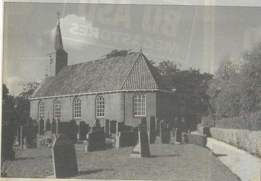
Recente opname van de N.H. kerk te Rottevalle.

Door Dirk R. Wildeboer te Buitenpost secretaris van de Stichting Oud-Achtkarspelen. tel. 0511-541920, internet http://home.hetnet.nl/~oudachtkarspelen